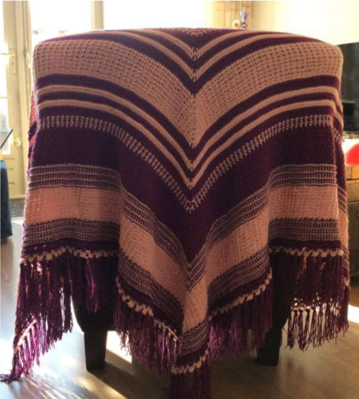
The Shawl of Muis is a design of Marjolein Kooiman

מעצבת: מרג'ולין קוימן (Marjolein Kooiman)