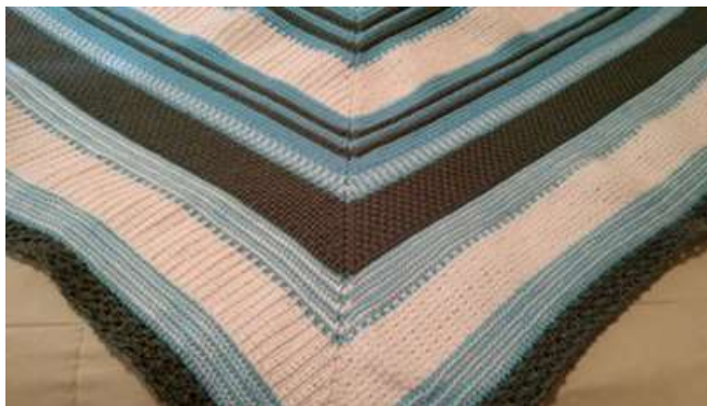
Melissa Loops & Threads