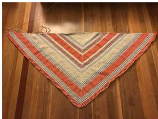
Rita Northcote cotton

Här är några sjalar som testarna från hela världen gjort. Mitt tack går till alla dessa testare, utan dem hade inte sjalen varit här.