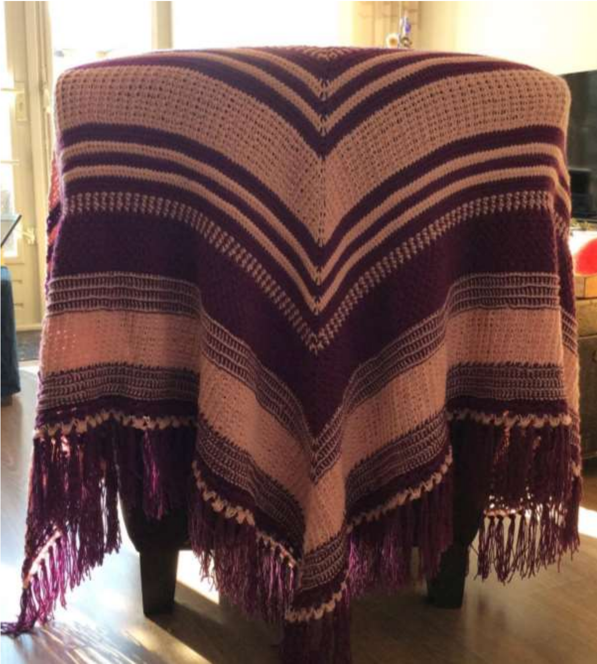
The Shawl of Muis er et design af Marjolein Kooiman